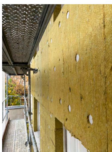
Mise en oeuvre de l'isolant