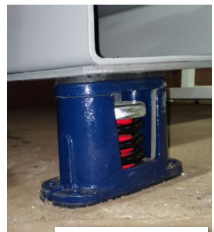
SUPPORTS RÉDUISANT DE 99% LES BRUITS SOLIDIENS