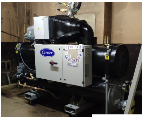
LA NOUVELLE PAC GÉOTHERMIE